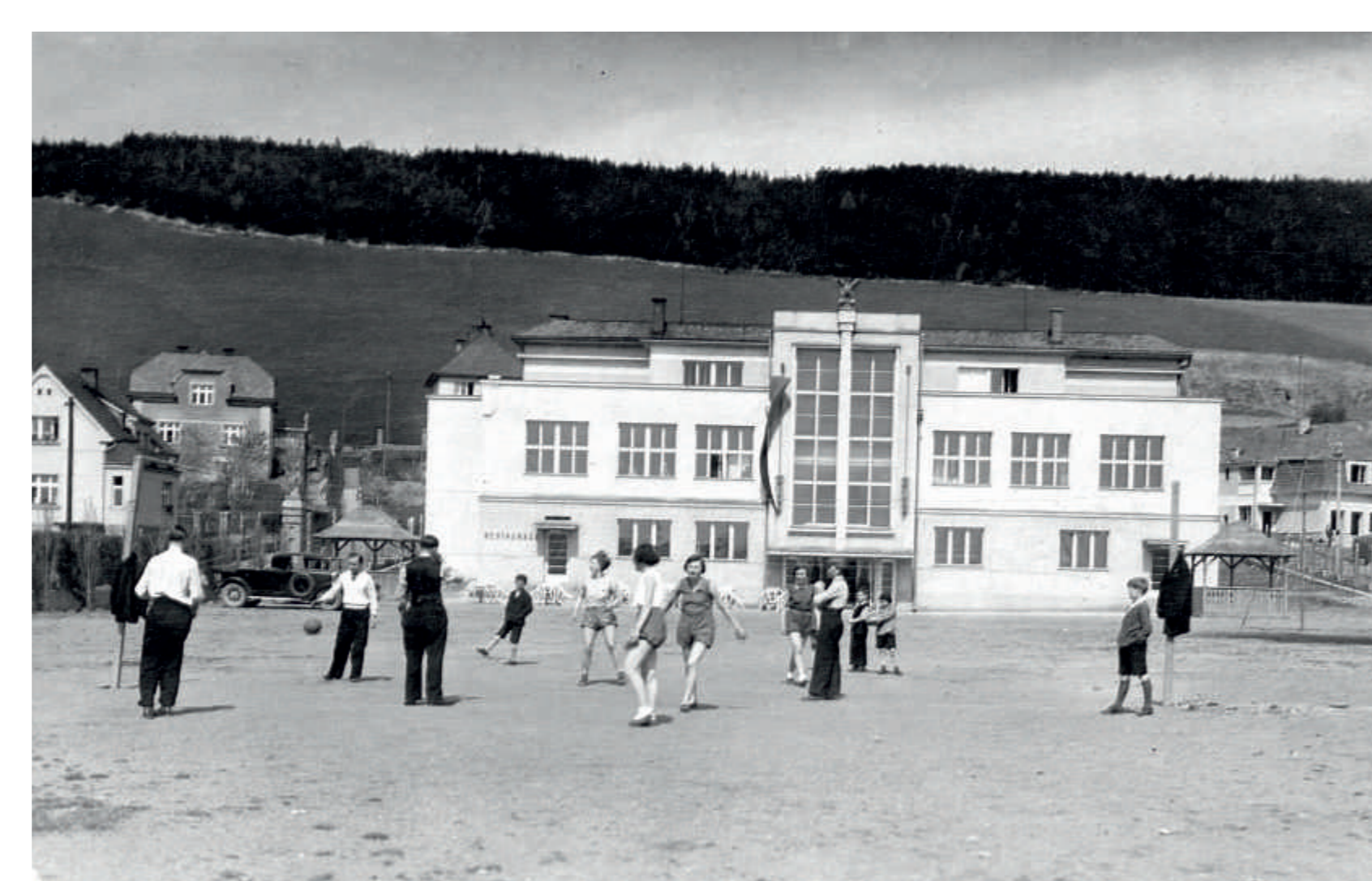
Nová sokolovna byla postavena v roce 1932