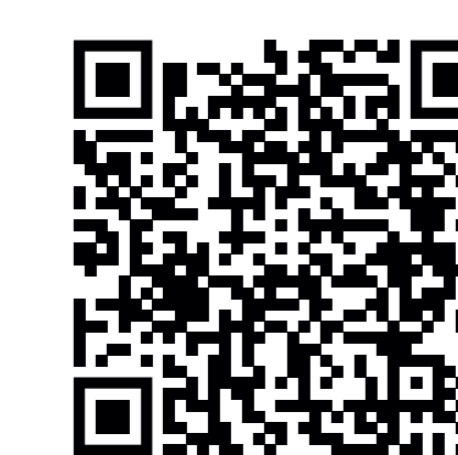
Sport a místní oddíly

Stezku zajistila v roce 2022 svými prostředky Městská část Praha 16