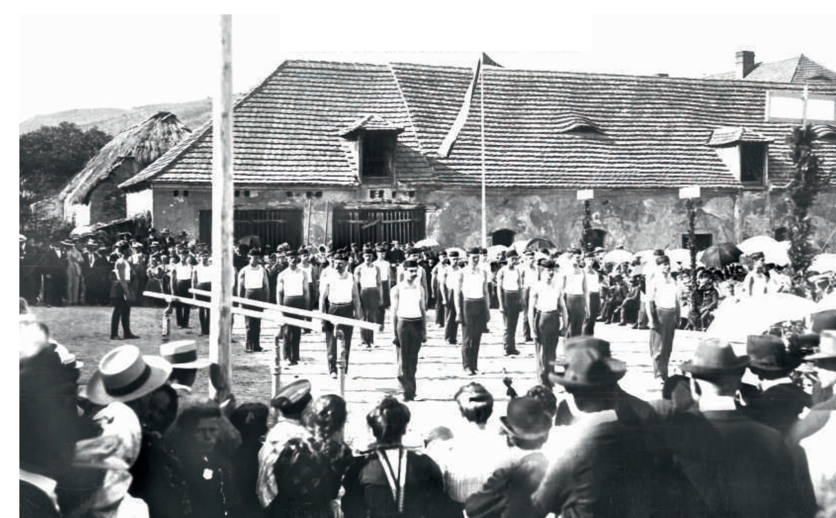
Cvičení sokolů za stodolou Drchotova statku