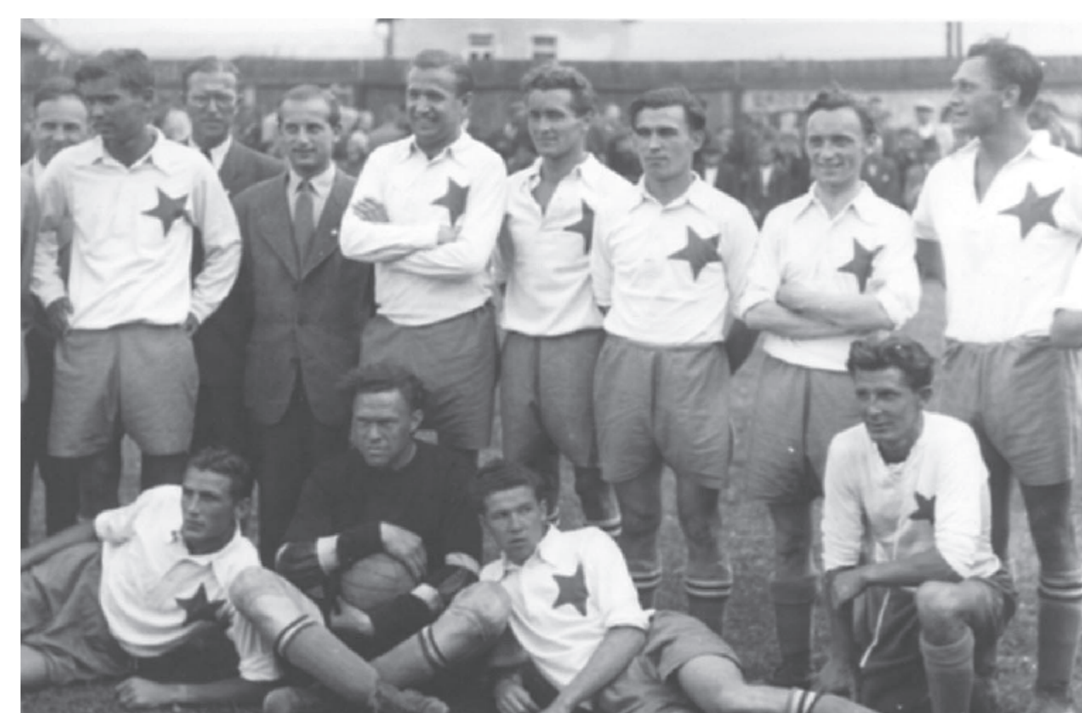
Místní fotbalisté se hráli v roce 1945 zápas s SK Slavia, v jejímž dresu nastoupil legendární Josef Bican (zcela vpravo)