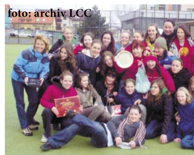
Pražské lakrosové naděje