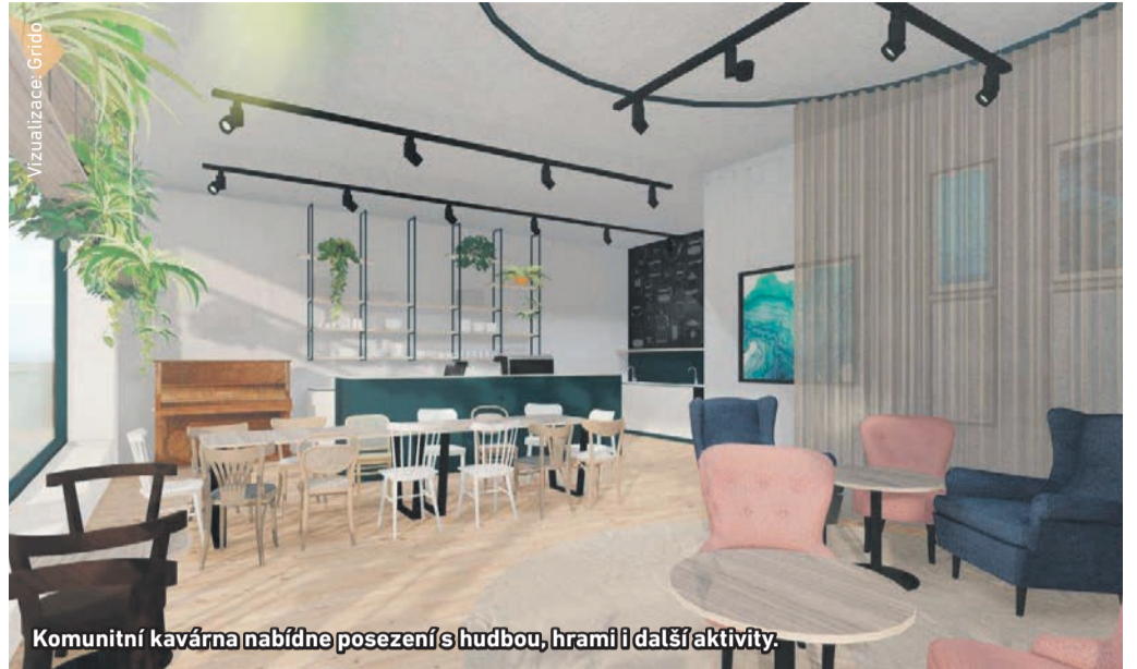
Komunitní kavárna nabídne posezení s hudbou, hrami i dalšími aktivitami.

B ohatý program pro všechny generace plánuje komunitní centrum, které bude srdcem celého nového komplexu za Korunou. „Nabídneme další aktivity, na které nebyl v Koruně prostor – aktivní zábavu, vzdělávání, relaxaci a náplň pro volný čas seniorům, mládeži, rodinám s dětmi a také teenagerům. V tomhle unikátním Fajnu novém dvoře bude prostě všem dobře!“ říká Dana Radová, která vedle Kulturního střediska u Koruny povede i Fajn Nový Dvůr Koruna, jak se bude komunitní centrum jmenovat.