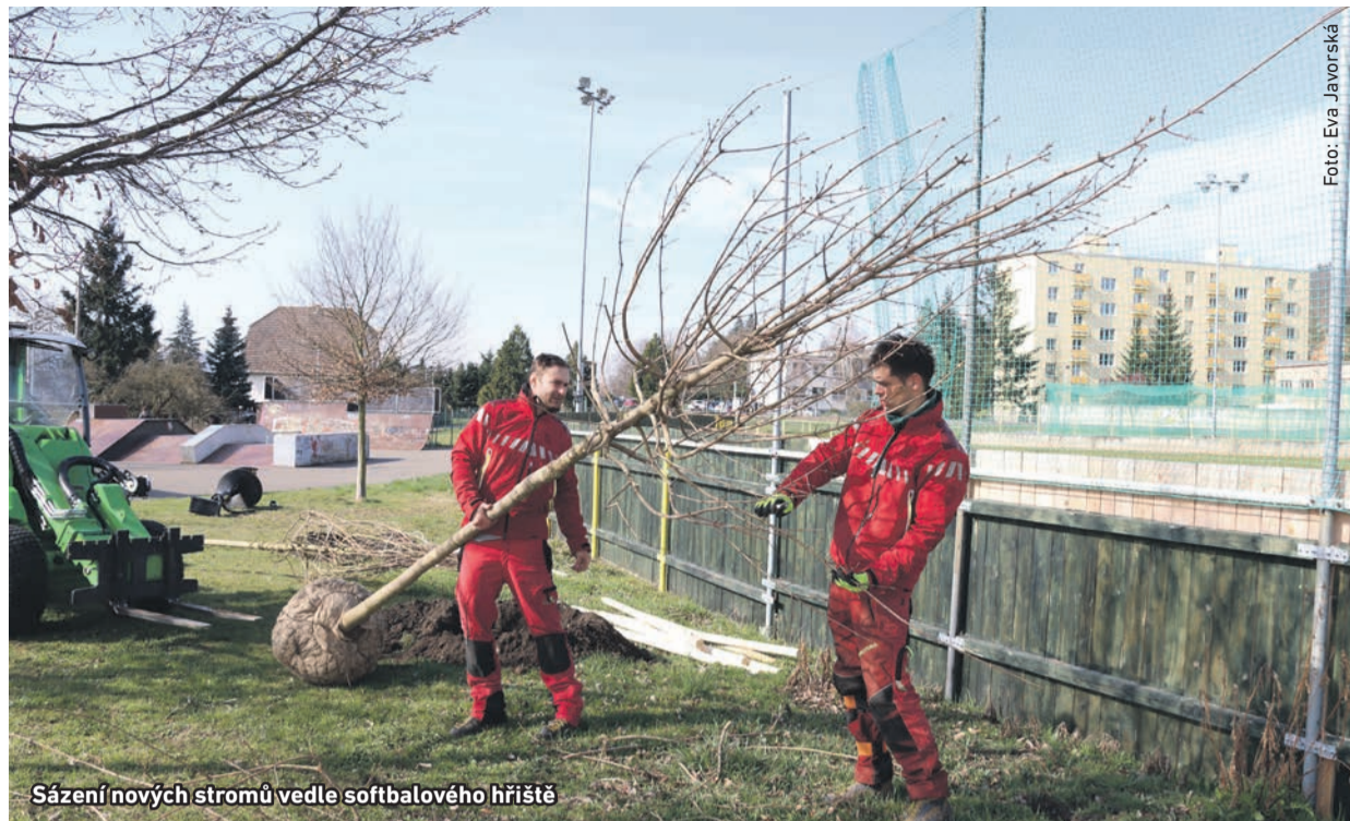
Sázení nových stromů vedle softbalového hřiště