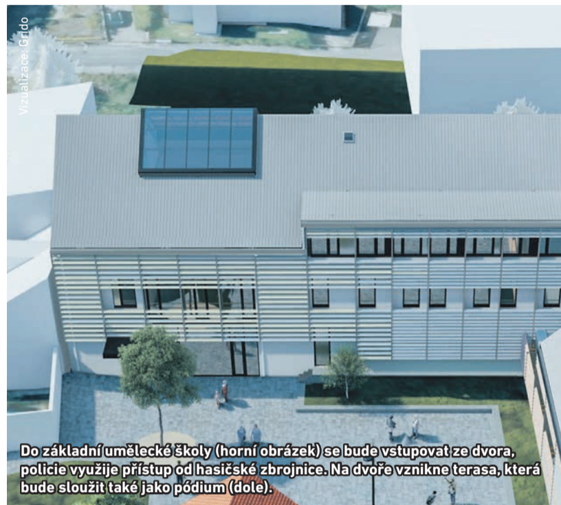
Do základní umělecké školy (horní obrázek) se bude vstupovat ze dvora, policie využije přístup od hasičské zbrojnice. Na dvoře vznikne terasa, která bude sloužit také jako pódium (dole).

Jednu z budov v novém komplexu za Korunou obsadí radotínská základní umělecká škola. Na nové prostory se může těšit výtvarný a taneční obor, v přízemí vzniká malý koncertní sál. Výuka hry na nástroje bude pokračovat ve Zderazské ulici. Žáci a jejich rodiče se poprvé do nových prostor podívají v září, kdy začne nový školní rok.