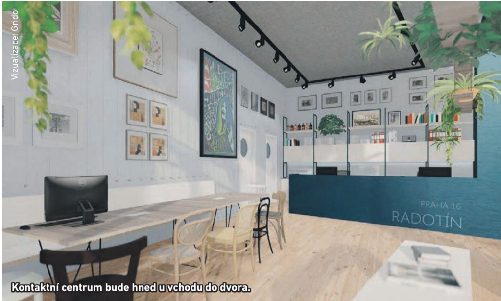
Kontaktní centrum bude hned u vchodu do dvora.