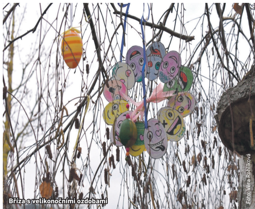
Bříza s velikonočními ozdobami