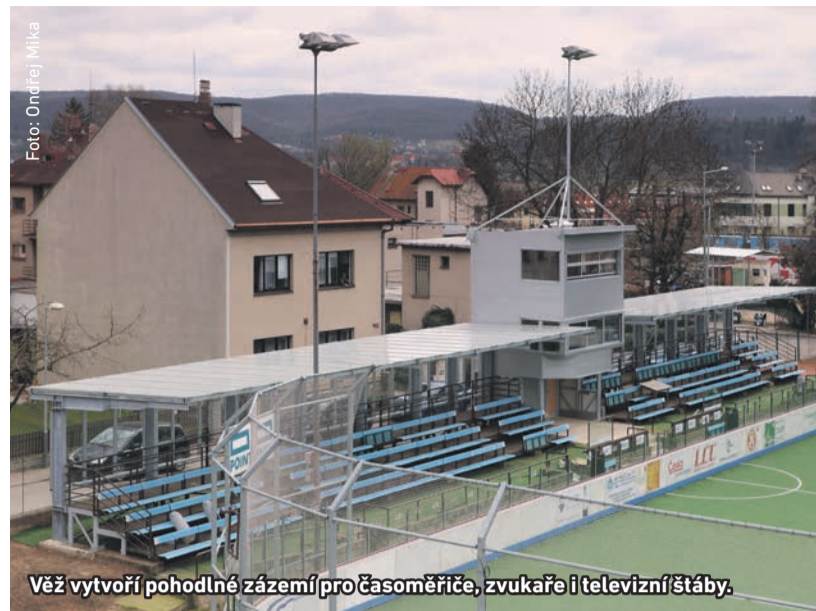
Věž vytvoří pohodlné zázemí pro časoměřiče, zvukaře i televizní štáby.