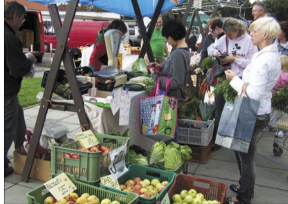
Radotínské farmářské trhy 3. září 2010

Tento, ale i další sortiment si pak budou moci občané od českých farmářů nakoupit každý druhý pátek – nyní 17. září a dále 1. a 15. října vždy od 10.00 do 18.00 hodin. Jarní pokračování trhů se předpokládá od druhé půle dubna 2011.