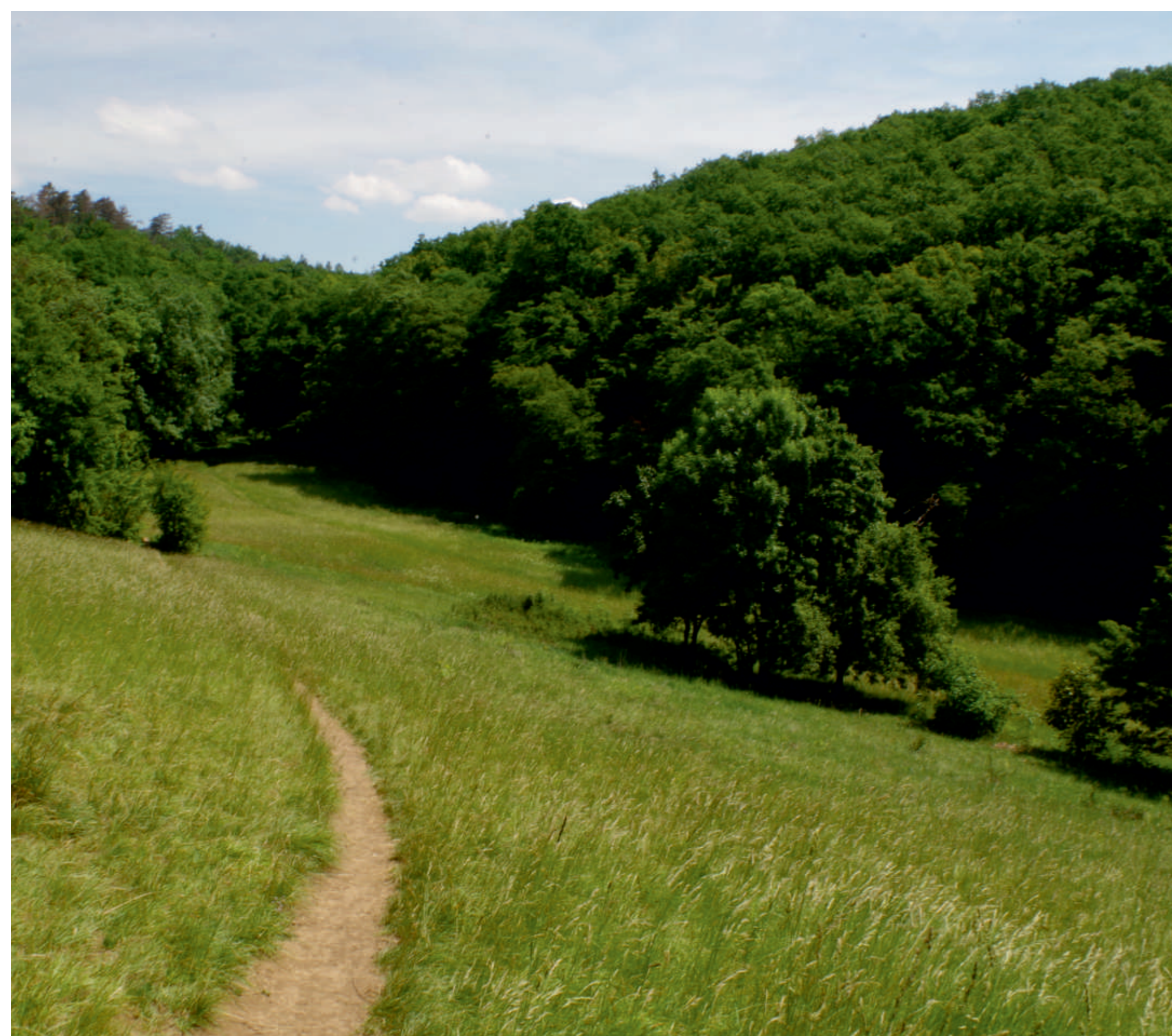
Celkový pohled na Slavičí údolí

Zarůstání louky a následnému poklesu biodiverzity zabraňuje pravidelné kosení a prořezávání náletových dřevin. Dlouhodobým cílem ochrany přírodní rezervace je úplně odstranit nepůvodní invazivní druhy rostlin, jako je trnovník akát nebo pámelník bílý.