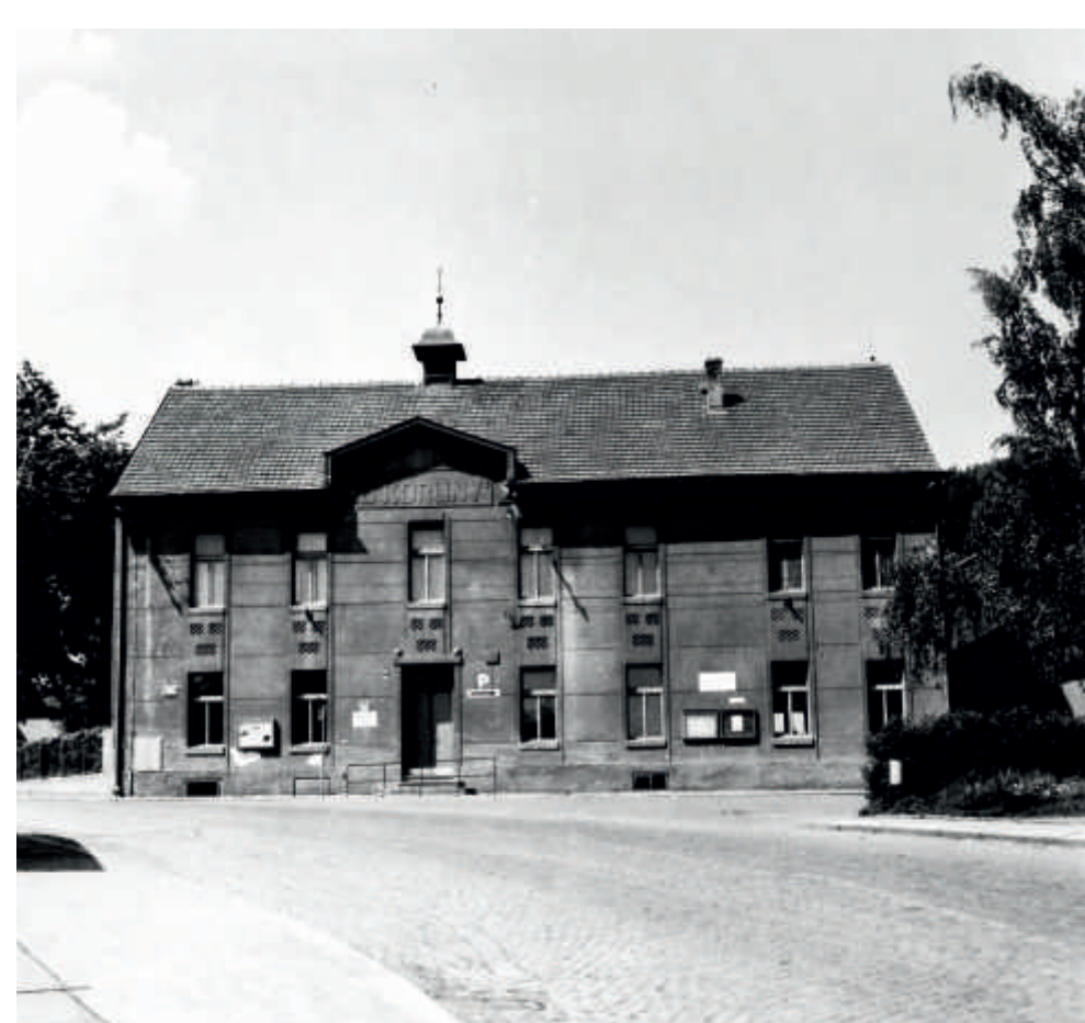
Omšelý dům "U Koruny" v roce 1970

Nové centrum Koruna vzniklo rozsáhlou přestavbou areálu. Prvním krokem byla výstavba nové zbrojnice pro dobrovolné hasiče jako náhrada za budovu v havarijním stavu. Celý prostor byl následně revitalizován souhrnnou investicí 128 milionů korun obsahující čtyři objekty se zcela odlišným využitím: kulturně-komunitní centrum, sociální projekt Dům na půli cesty, služebna Policie ČR a Základní umělecká škola Klementa Slavického. Soubor staveb dokončený v srpnu 2021 se podařilo realizovat díky dotacím z fondů EU, rozpočtu Hlavního města Prahy a vlastních zdrojů Městské části Praha 16.