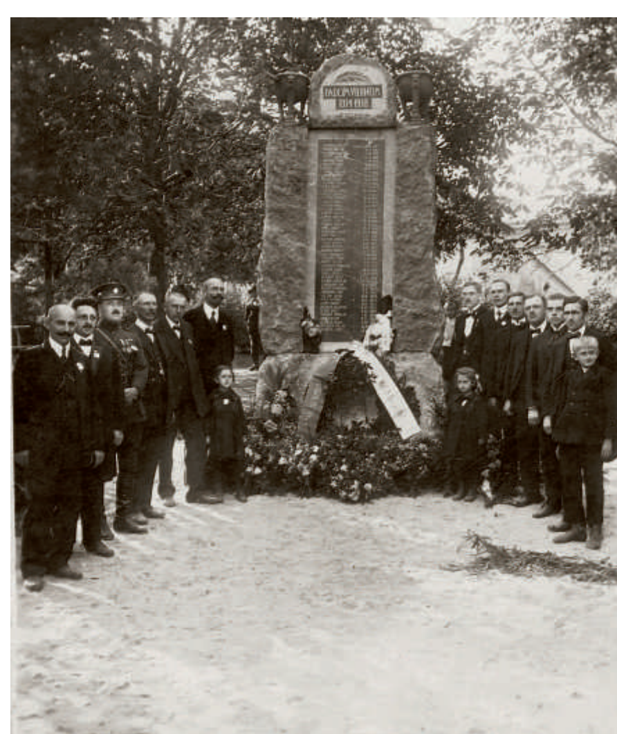
Odhalení pomníku obětem války v roce 1921

než původním korytem, proto potok místní nazývali Jalovým. Uprostřed parku u silnice stojí pomník obětem válek. Památník padlých i zemřelých vojáků ve světové válce byl slavnostně odhalen 2. října 1921 za účasti obecního zastupitelstva, místních spolků a korporací i širší veřejnosti. Po druhé světové válce byl rozšířen o pamětní desku jejím obětem, na památku zákeřně usmrceným a také hrdinům padlých v květnových bojích o Radotín. Celkovou rekonstrukcí prošel v roce 2016.