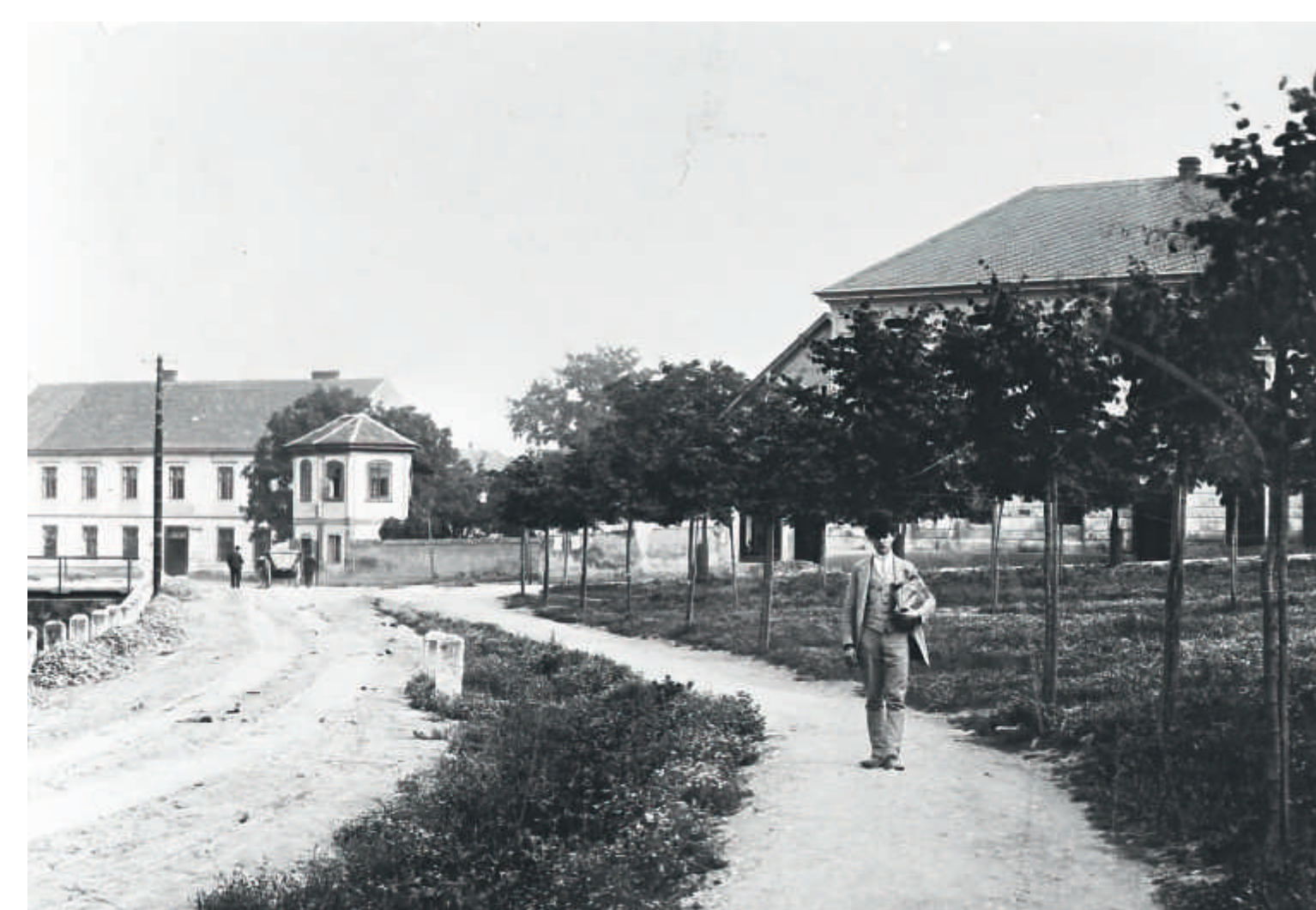
Stará náves u potoka s čerstvě vysázenými jírovci (dnešní světelná křižovatka)