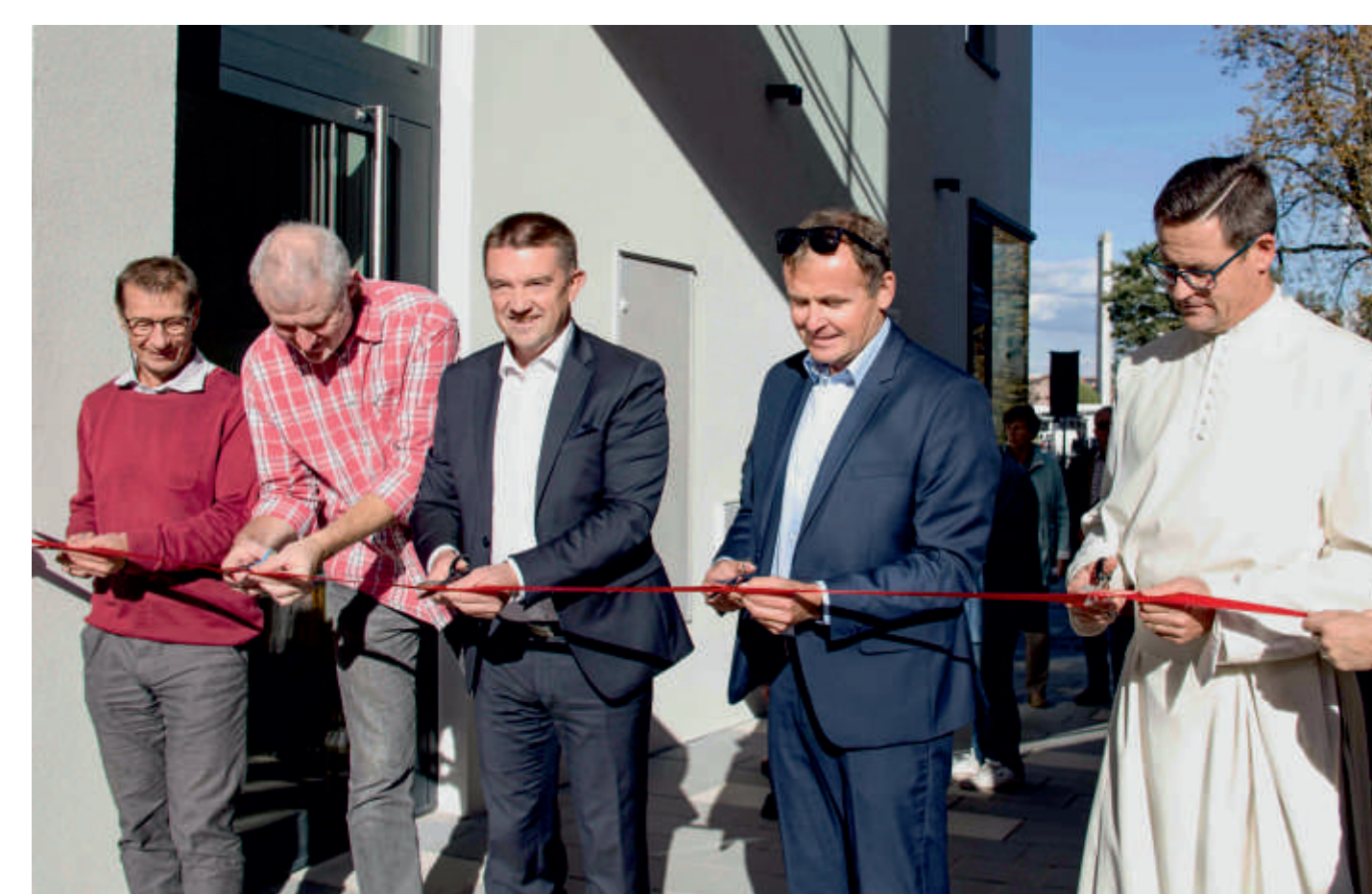
Slavnostní otevření nového víceúčelového komplexu v září 2021

než původním korytem, proto potok místní nazývali Jalovým. Uprostřed parku u silnice stojí pomník obětem válek. Památník padlých i zemřelých vojáků ve světové válce byl slavnostně odhalen 2. října 1921 za účasti obecního zastupitelstva, místních spolků a korporací i širší veřejnosti. Po druhé světové válce byl rozšířen o pamětní desku jejím obětem, na památku zákeřně usmrceným a také hrdinům padlých v květnových bojích o Radotín. Celkovou rekonstrukcí prošel v roce 2016.