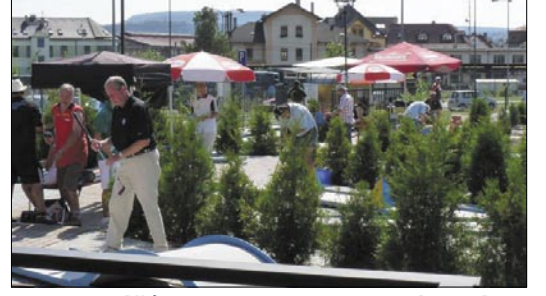
Na 30 hráčů zaplnilo minigolfový areál