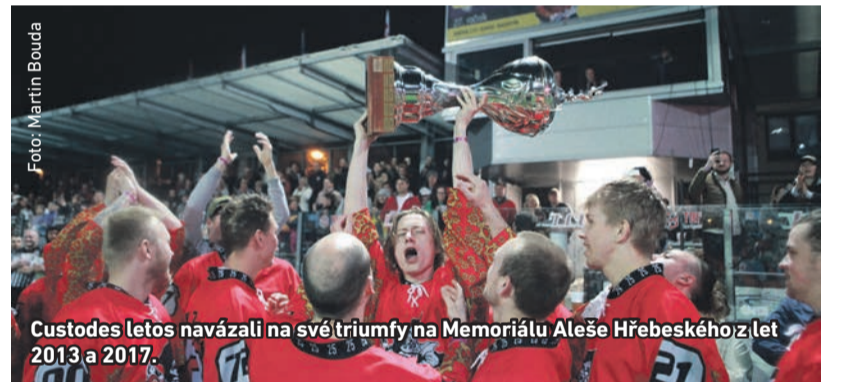
Custodes letos navázali na své triumfy na Memoriálu Aleše Hřebeského z let 2013 a 2017.