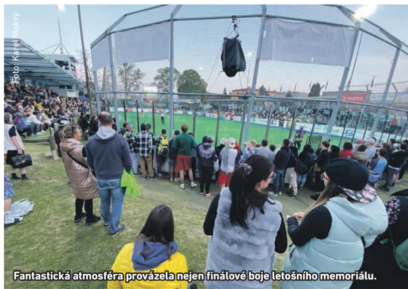
Fantastická atmosféra provázela nejen finálové boje letošního memoriálu.