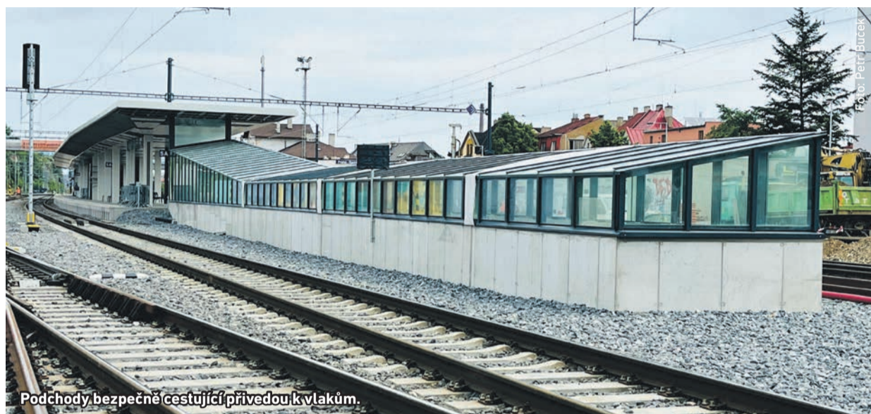
Podchody bezpečně cestující přivedou k vlakům.

Chodci si v centru Radotína postupně začnou zvykat na nové chodníky a lávku. Na jaké novinky se mohou těšit?