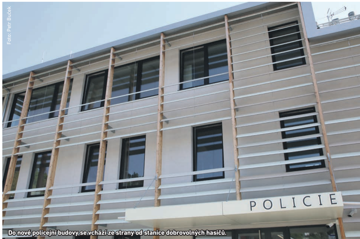
Do nové policejní budovy se vchází ze strany od stanice dobrovolných hasičů.

Republikoví policisté využívají od loňského listopadu novou služebnu mezi Korunou a stanicí dobrovolných hasičů. Přestěhovali se sem ze staré budovy z Výpadové ulice, kterou od nich převzala dálniční policie.