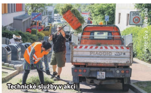
Technické služby v akci