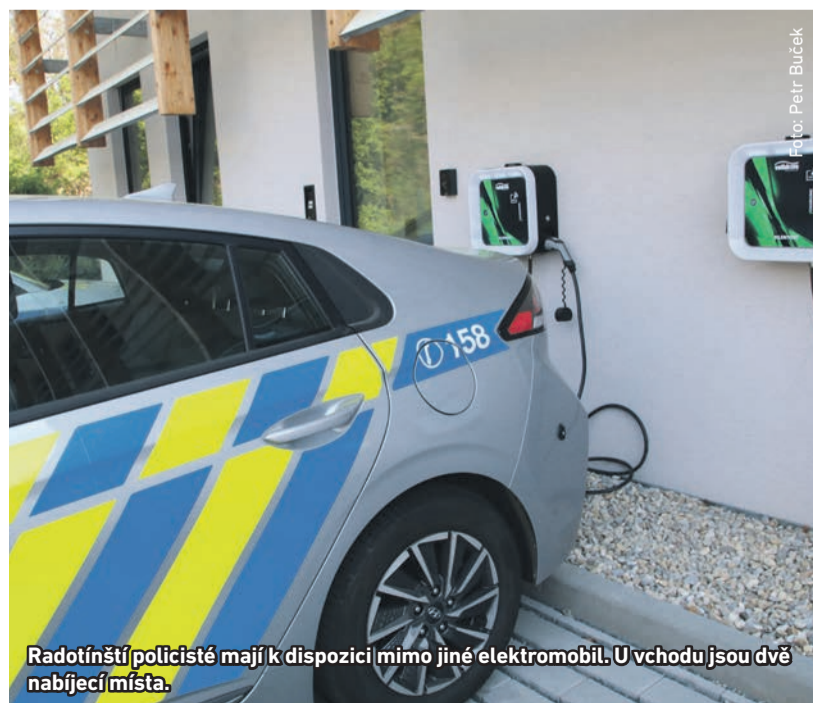
Radotínští policisté mají k dispozici mimo jiné elektromobil. U vchodu jsou dvě nabíjecí místa.