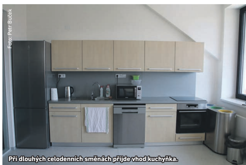
Při dlouhých celodenních směnách přijde vhod kuchyňka.