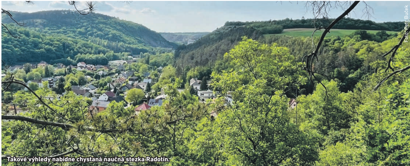
Takové výhledy nabídne chystaná naučná stezka Radotín.

R adnice od loňského roku připravuje zcela novou naučnou stezku Radotín. Bude mít délku přesahující 11 kilometrů a místní občany i návštěvníky zavede do nejkrásnějších míst v městské části