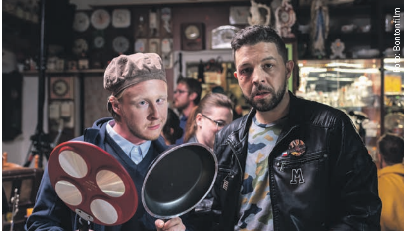
Tři Tygři se tentokrát představují ve filmu Jackpot.

Dělat dobré skutky může být děsná dřina. Zvlášť když vás má celý svět za padouchy. Animovaná komedie Zlouzí z legendárního studia DreamWorks Animation dokazuje, že i v na první pohled nebezpečném tvorovi se může skrývat dobré srdce.