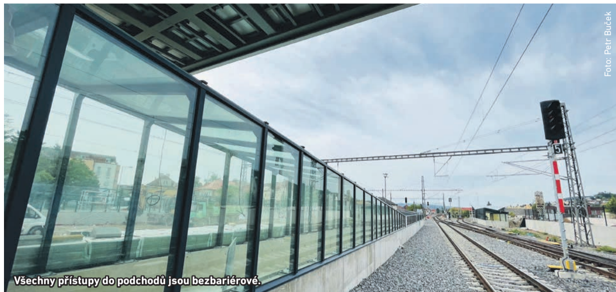
Všechny přístupy do podchodů jsou bezbariérové.