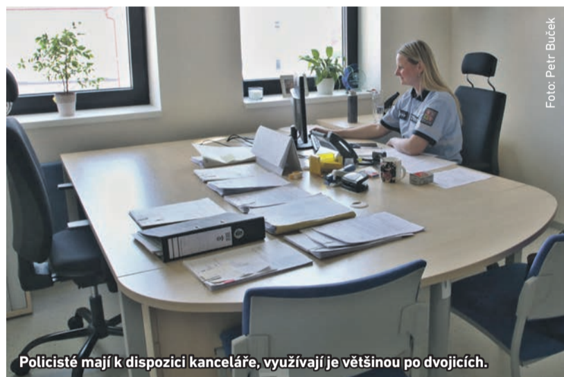
Policisté mají k dispozici kanceláře, využívají je většinou po dvojicích.