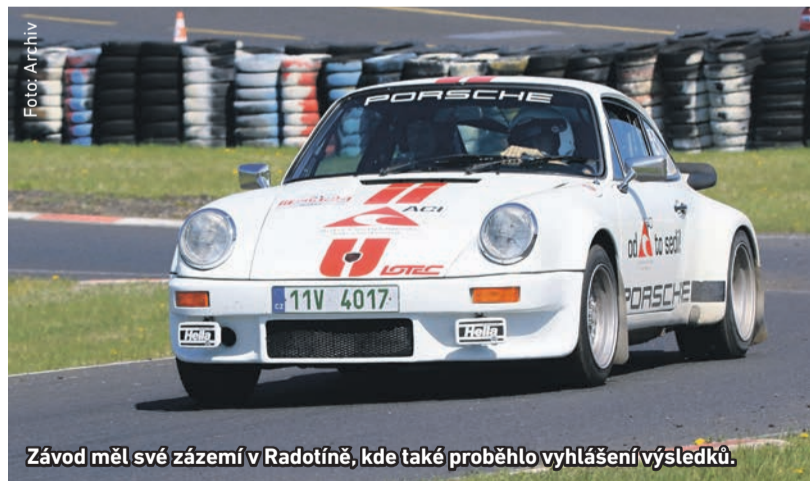
Závod měl své zázemí v Radotíně, kde také proběhlo vyhlášení výsledků.

V rámci 11. ročníku sportovně-spoločenské akce Rallye Praha Revival – memoriál Dalibora Janka se sešlo 150 posádek v historických soutěžních a sportovních automobilech z jedenácti zemí Evropy. Čekalo je 600 kilometrů po silnicích středních a severních Čech s cílem v Radotíně.