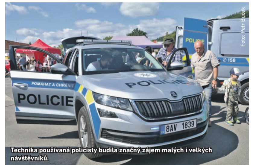
Technika používaná policisty budila značný zájem malých i velkých návštěvníků.