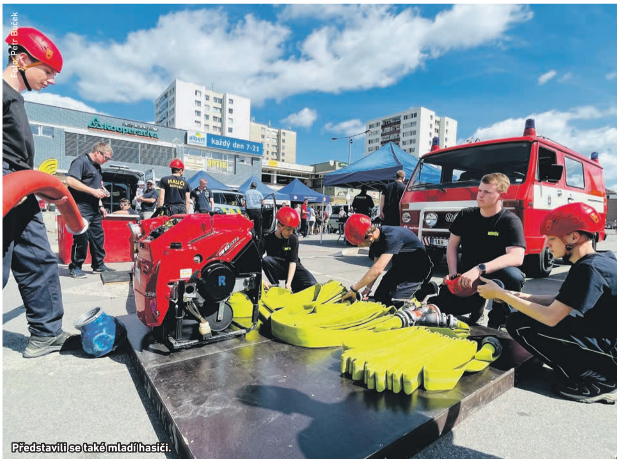
Představili se také mladí hasiči.

R adotín pořádá tradiční Den s integrovaným záchranným systémem, na kterém představili své umění hasiči, policisté i zdravotníci. Malí i velcí návštěvníci si mohli prohlédnout záchrannou techniku a vybavení. Policisté sehráli zásah, při kterém zadrželi nebezpečnou osobu, hasiči zase ukázali, jak zvládají požáry. Nechyběla ani u nejmenších dětí velmi populární hasičí