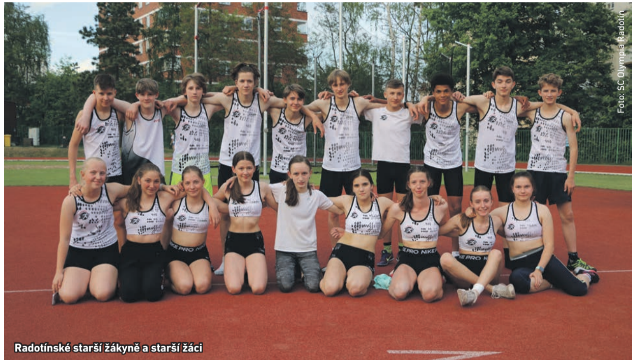
Radotínské starší žákyně a starší žáci