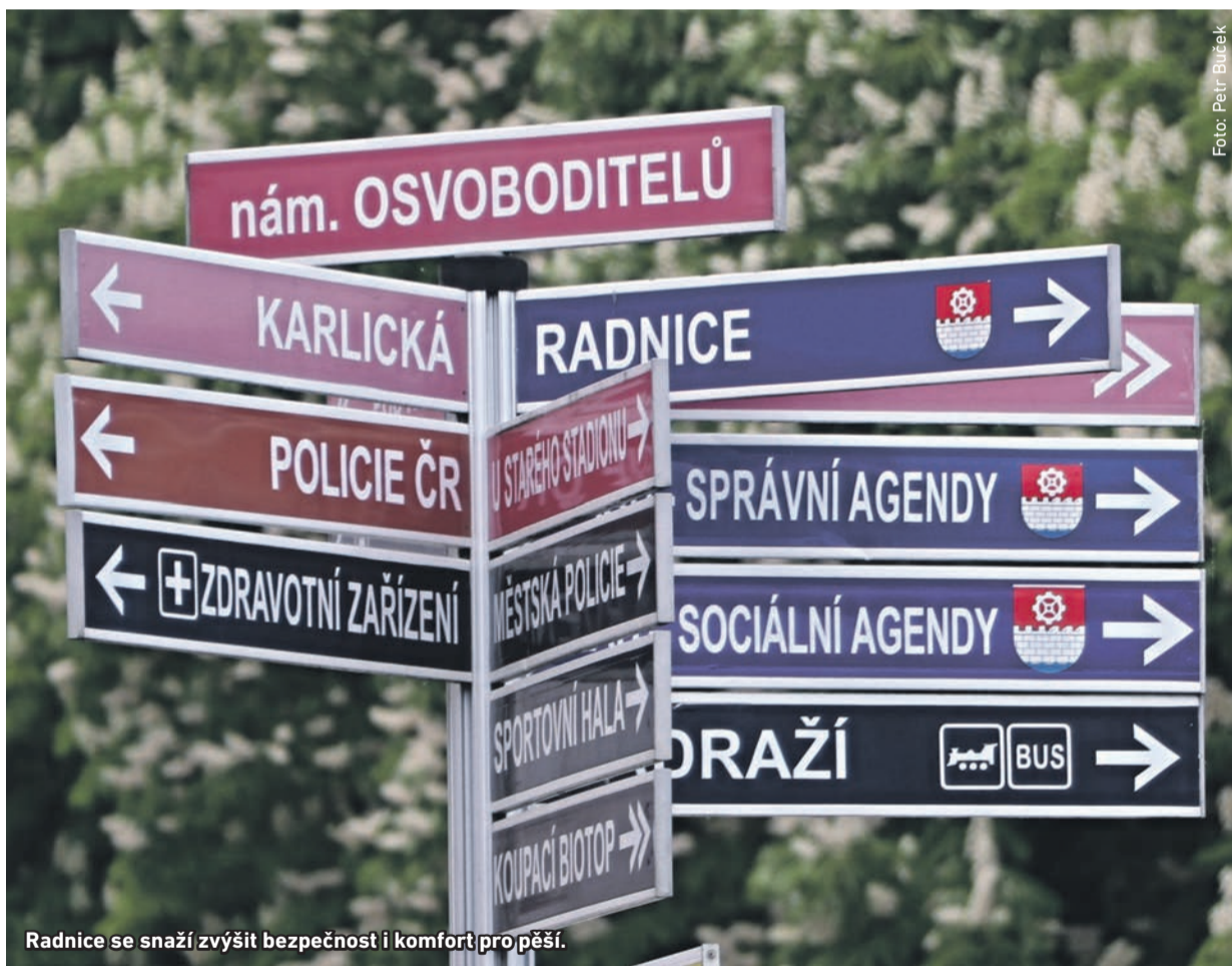
Radnice se snaží zvýšit bezpečnost i komfort pro pěší.

Především chodcům začíná v Radotíně malá revoluce. Po centru městské části využijí jiné trasy, než byli po dlouhé desítky let zvyklí. Kromě komfortu se díky novým podchodům, chodníkům a lávkám mohou těšit na vyšší bezpečnost.