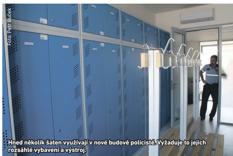
Hned několik šaten využívají v nové budově policisté. Vyžaduje to jejich rozsáhlé vybavení a výstroj.