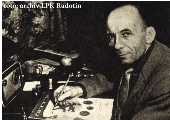
Karel Liška, uznávaný grafik, heraldik a sfragistik

Někdykrát vystavoval a přednášel také v Radotíně a ve Zbraslavi. Znak Radotína tvoří červený štít, jehož modrá vlnovitá pata symbolizuje řeku Berounku. Z paty štítu vystupuje stříbrná městská zeď z kvadrů se šesti stínkami, nad zdí uprostřed červeného pole je stříbrné ozubené kolo se čtyřmi rameny, osmi zuby a čtyřhranným otvorem uprostřed, vyjadřující zdejší průmyslovou tradici.