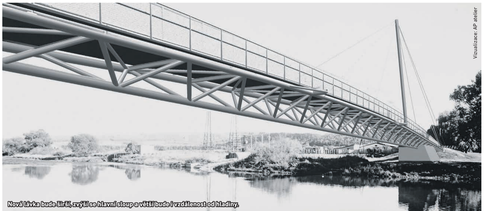
Nová lávka bude širší, zvýší se hlavní sloup a větší bude i vzdálenost od hladiny.

Dlouhé čekání na novou lávku přes Berouнку skončí nejspíše už příští rok v létě. Nakonec zmizí most, který je v havarijním stavu. Nahradí ho na první pohled podobná, ale technicky dokonalejší varianta. Přečhod přes řeku bude možný po celou dobu stavby.