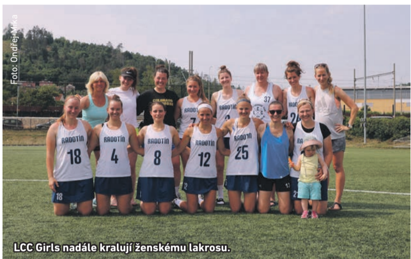
LCC Girls nadále kralují ženskému lakrosu.