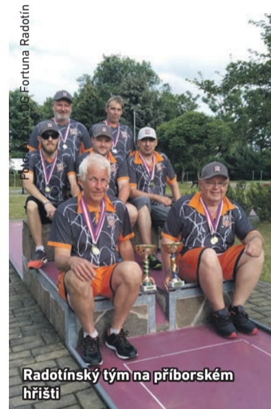
Radotínský tým na příborském hřišti