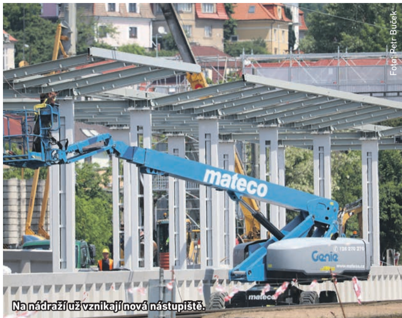
Na nádraží už vznikají nová nástupiště.