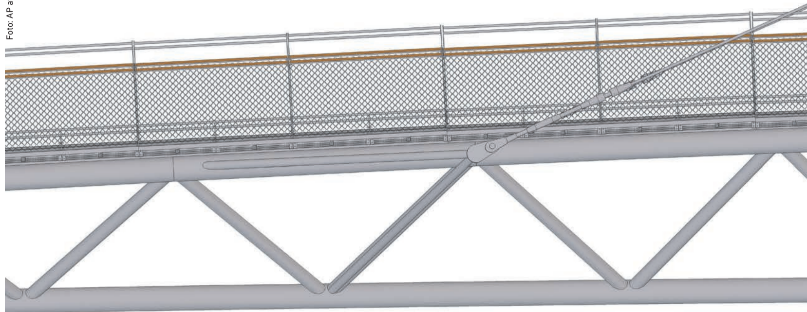
Detail boční části lávky