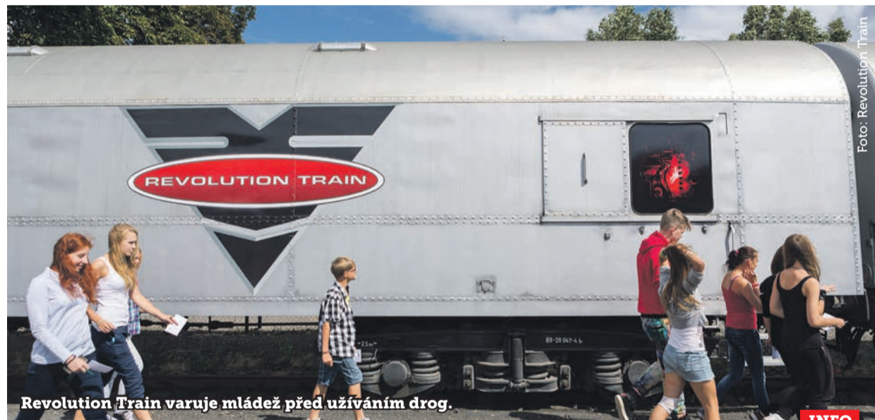
Revolution Train varuje mládež před užíváním drog.