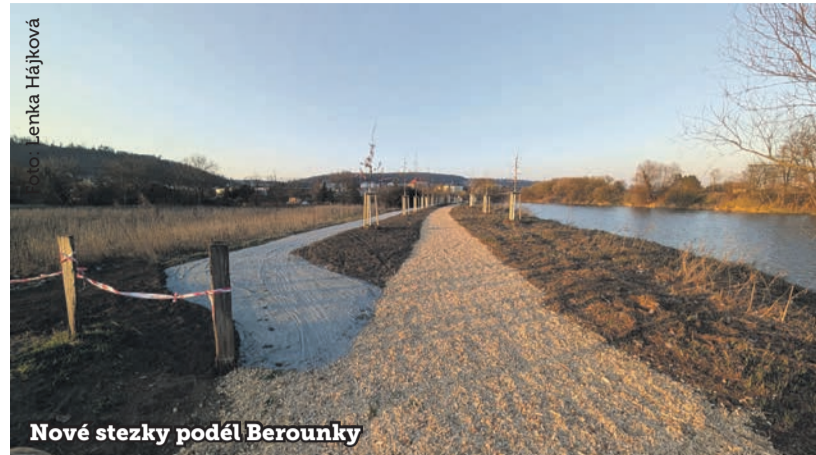
Nové stezky podél Berounky

R adotínská radnice pokračuje v kultivaci břehu Berounky. Nové jsou cesty od biotopu směrem k Říčním lázním.