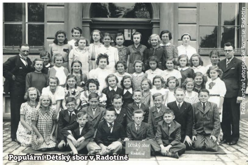
Populární Dětský sbor v Radotíně