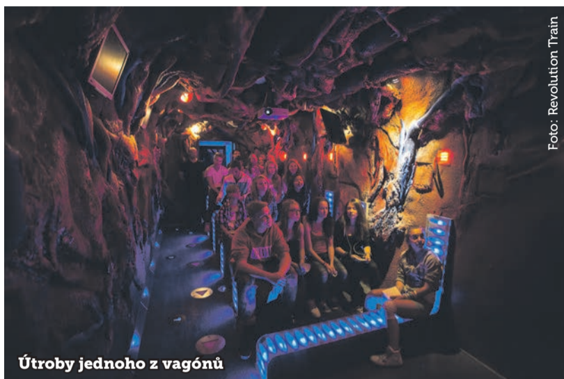
Útroby jednoho z vagonů

Zdvíhnutím projekčního plátna se návštěvníkům propojuje virtuální a reálné prostředí (bar, autonehoda, drogové doupě, výslechová místnost). Díky interaktivním technologiím se ve stominutovém příběhu děti a mládež stávají jeho aktivními účastníky.