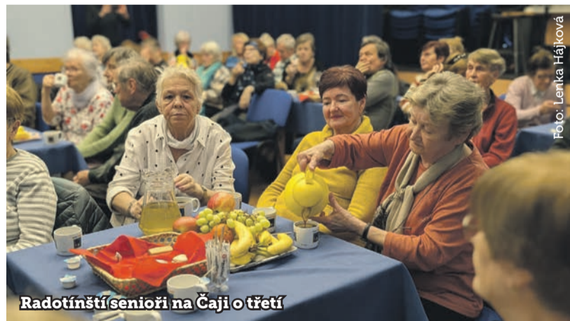
Radotínští seniori na čaji o třetí

Na tradiční setkání radotínských senierek a seniorů dorazilo do Koruny 70 návštěvníků. Čaj o třetí nabídl odpoledne s přátelským posezením a trampskými písněmi.